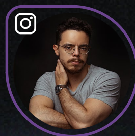
ISRAEL CARVALHO @israelsouzadecarvalho